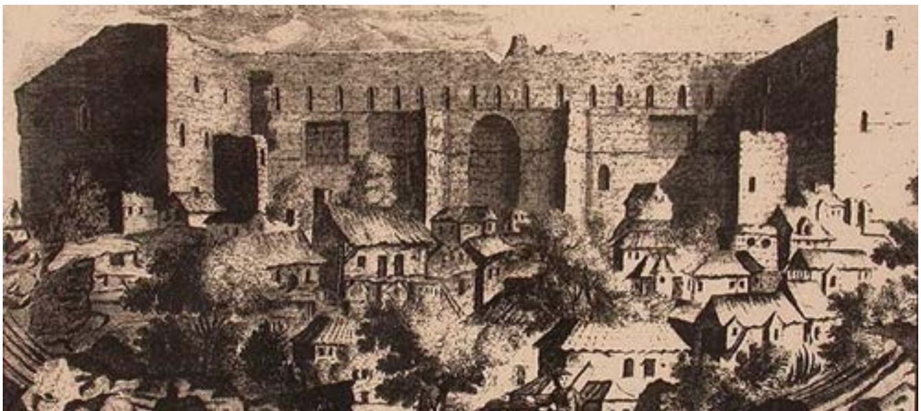
Gravure représentant les maisons dans le Théâtre, avant sa rénovation.