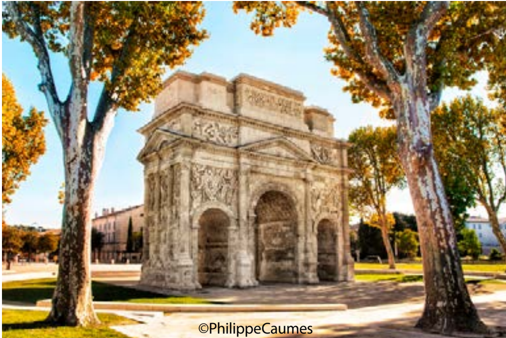
L'Arc de triomphe de la ville d'Orange, de nos jours

La ville romaine se caractérise par ses monuments publics. Elle possède généralement un Théâtre, un forum*, un temple, un cirque, un Arc de triomphe* et des thermes*.