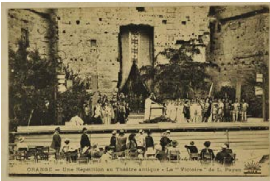
Répétitions pour le spectacle «La Victoire» de Louis Payen (Circa 1908).